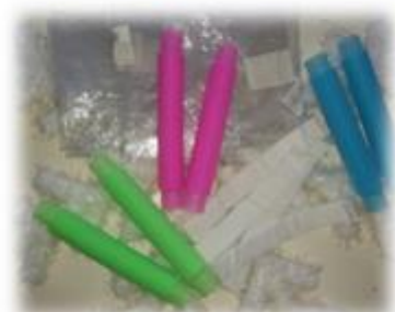
ПОП ИТ, КОНТАКТНАЯ ЛЕНТА И ПАКЕТ ШУРШАЩИЙ ДЛЯ МУЗЫКАЛЬНОЙ ИМИТАЦИИ ЗИМНИХ ЗАБАВ