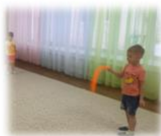
ДОБЫВАНИЕ ВЕТРА С ГОФРИРОВАННОЙ ТРУБОЙ