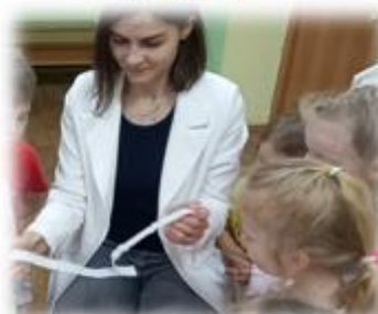
СОВМЕСТНОЕ ИЗГОТОВЛЕНИЕ ДШИ ДЛЯ ЭЛЕМЕНТАРНОГО МУЗИЦИРОВАНИЯ

руководителя в ДОУ позволяет решать следующие развивающие задачи: