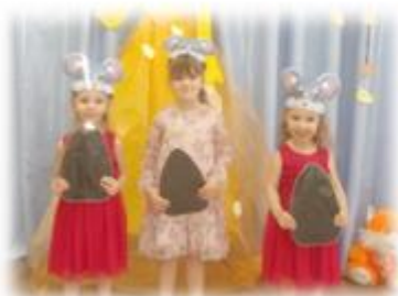
ШУРШАЩИЕ СЕМЕЧКИ ДЛЯ МЫШЕК

Хотелось бы отметить, что исследовательская технология в работе музыкального